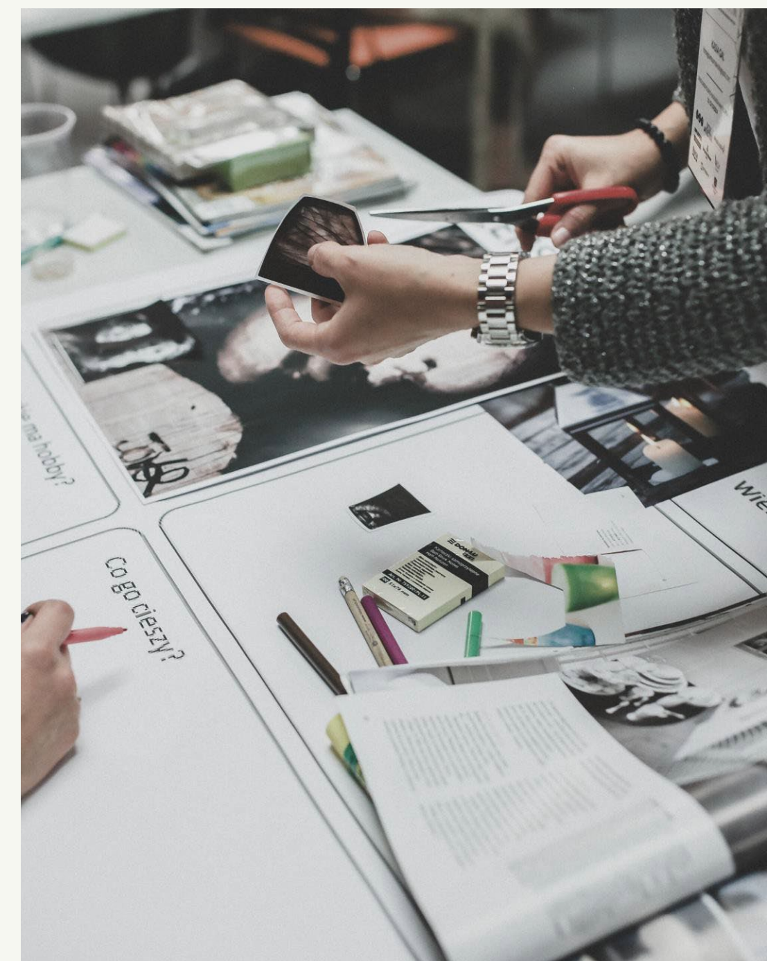
CONSULENZA PIANO MARKETING GEOLOCALIZZATO