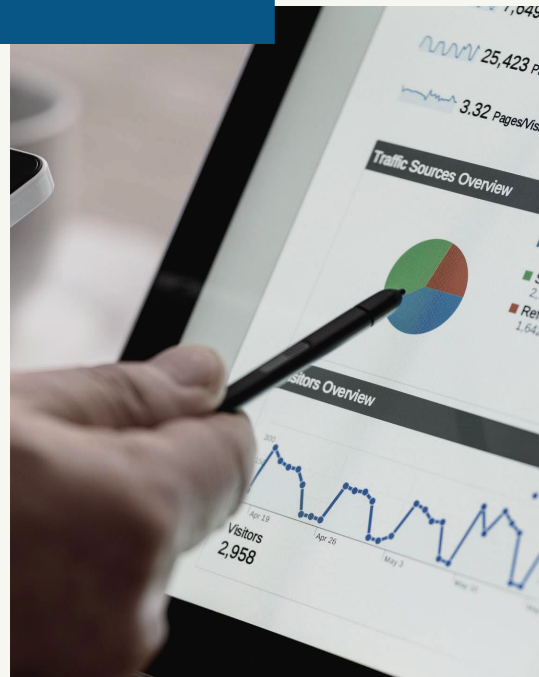
CONSULENZA PIANO MARKETING OTTIMIZZATO